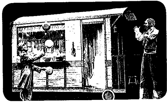
JEAN-CLAUDE GRUMBERG, Le Petit Violon , mise en scène d'Antoine Chalard (festival d'Avignon).

Qui vois-tu sur cette photographie ? Que font les personnages ?