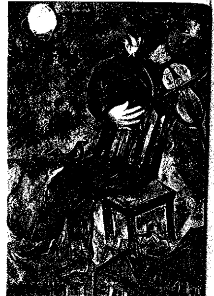
MARC CHAGALL, Le Violoniste bleu , huile sur toile, 1947.