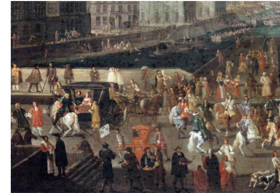
Des embouteillages à Paris au début du XVIII e siècle