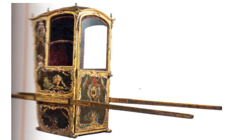
Une chaise à porteurs