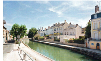
Un exemple de canal