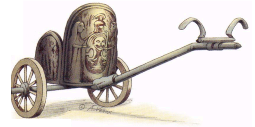
Un char romain