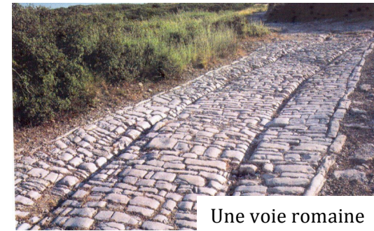
Une voie romaine