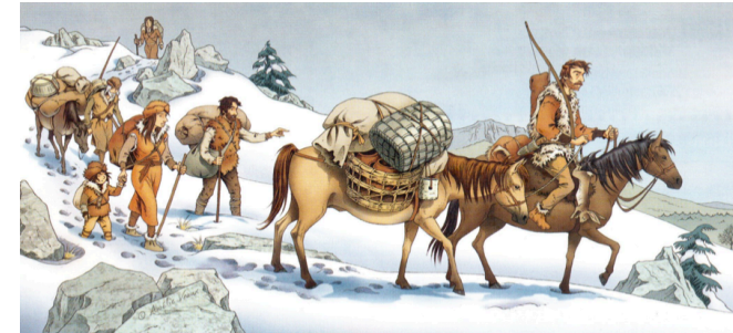
Doc 2 Le cheval comme moyen de transport