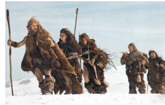
Doc 1 Le déplacement à pied d'un lieu de chasse à l'autre Image extraite du film de Jacques Malaterre, Ao, le dernier Neandertal, 2010

A la fin de la Préhistoire, avec l'amélioration des outils, les hommes inventent la ..... qui permet de se déplacer sur l'eau et de pratiquer la pêche plus facilement.