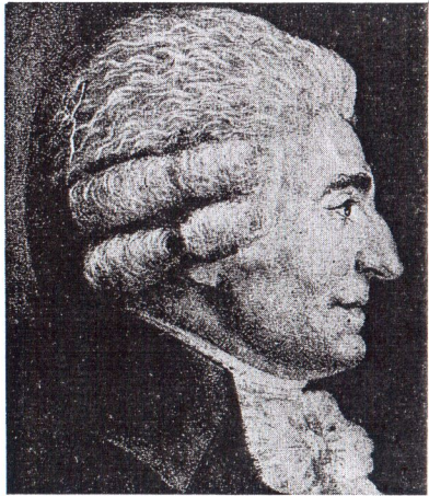
PARMENTIER (Antoine-Auguste) botaniste français (1737-1813)