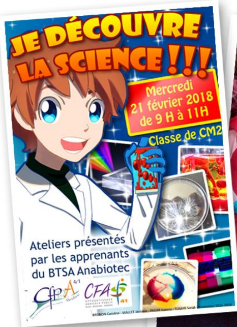
Affiche / flyer de l'événement

Un moment de partage et de découverte véritablement mémorable et passionnant, avec beaucoup de questions et d'émerveillement de la part des élèves... et des professeurs !